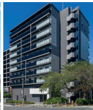
RELUXIA GRANDE YOKOHAMA YOSHINOCHO