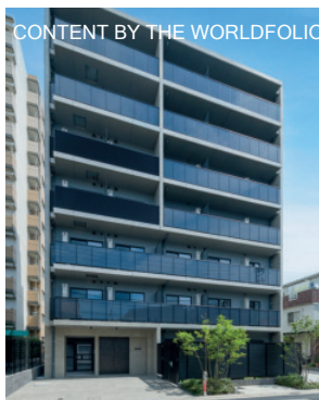
RELUXIA TOKYO NORTH GATE