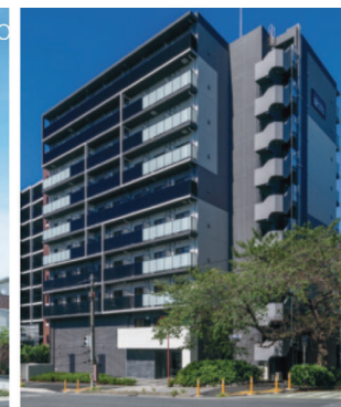
RELUXIA GRANDE 横濱吉野町