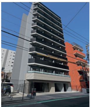
RELUXIA YOKOHAMA YOSHINOCHOIII