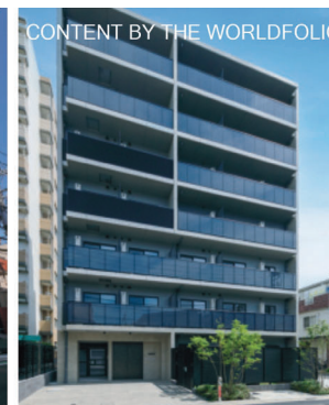
RELUXIA TOKYO NORTH GATE